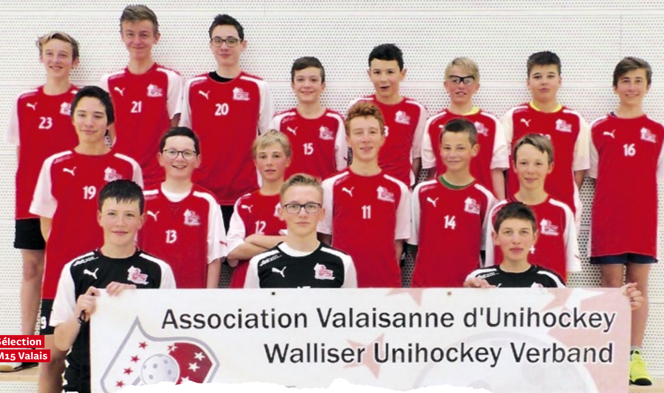
Sélection M15 Valais