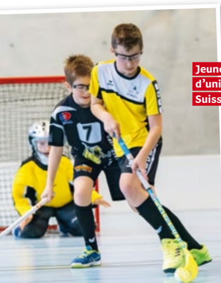
Jeunes talents d'unihockey en Suisse romande.

Plus d'informations sous www.u15-trophy-2017.ch