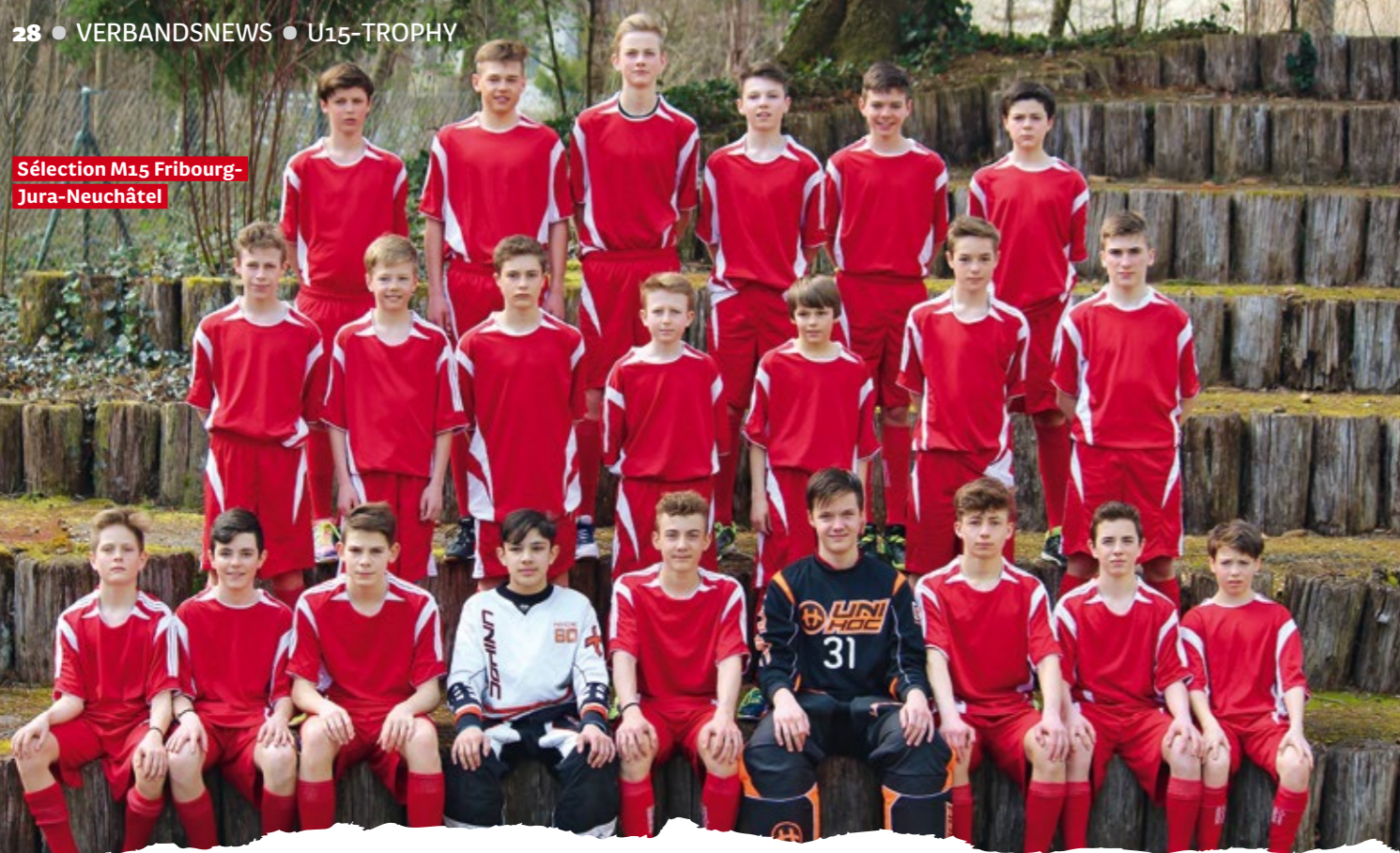
Sélection M15 Fribourg- Jura-Neuchâtel