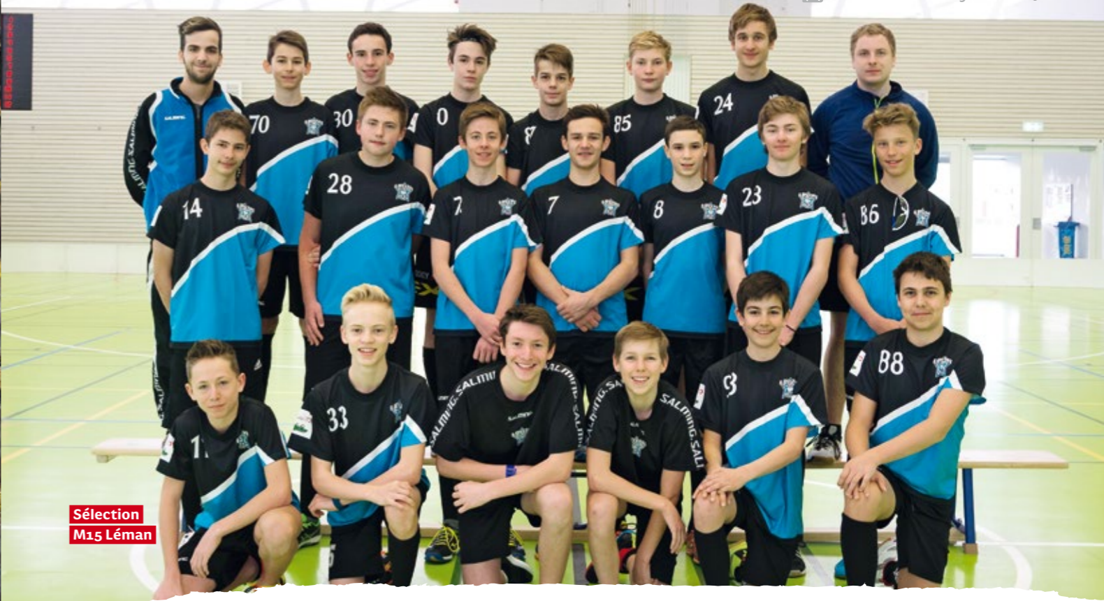
Sélection M15 Léman